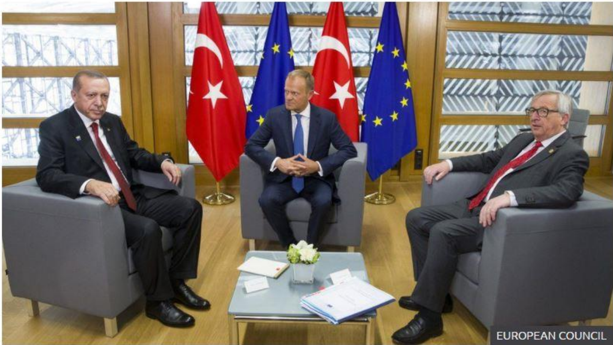
When the Turkish president visited Brussels in May 2017, there was no such diplomatic fallout